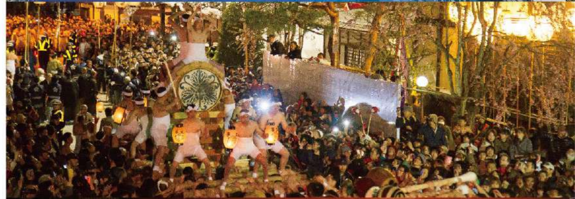
飛驒古川 漫步在恬靜美麗的城下町