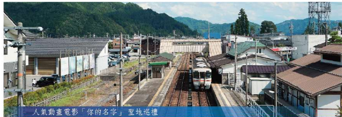
人氣動畫電影「你的名字」聖地巡禮